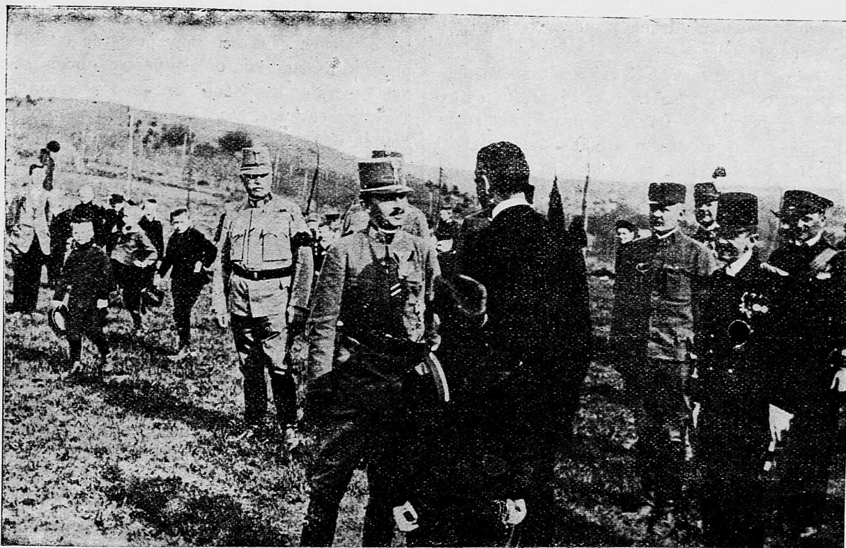
Král na fronte.

prvému punktu programu bola tedy do výhľadu postavená požička, čo sa ale obsahu tohto bodu týka, ten zas stojí v protive s válečnými programmami spojencov Ruska. V anglickom parlamente len pred pár dňami ministri Lloyd George a Cecil vyhlásili, že cieľom Anglicka je zaujatie územia a vymoženie odškodného od Nemcov a podobne znejú aj vyhlásenia francúzskych štátnikov. Že by nová ruská vláda k osvojeniu si tohto punkta vedela nakloniť svojich spojencov, je nadmier pochybné. Tí ľudia, ktorí teraz vedú ruský ľud, ešte vždy stoja pod anglickým vplyvom a preto prvý punkt programu novej vlády v otázke pokoja je potrebný len ku slepeniu ruského ľudu, ktorý od revolúcie česká pokoj a nie ďalšiu vojnu.