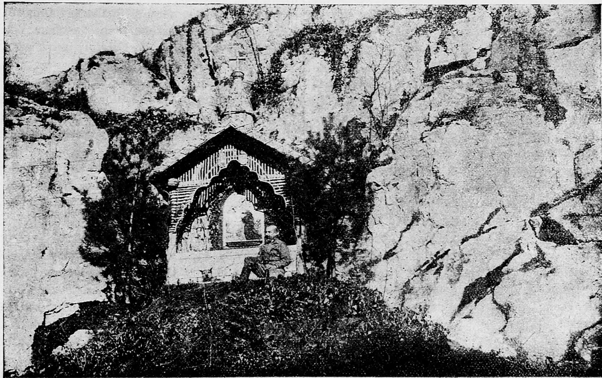
Káplnka uhorských vojakov na južnom fronte.