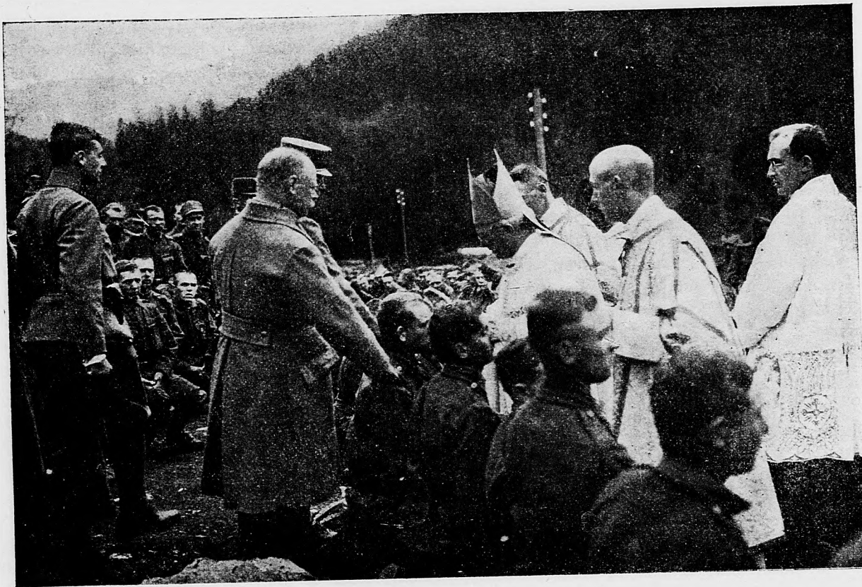
Sedmohradský biskup hirmuje na fronte.

Berlin, 13. júna. Zaľakovanie kráľa Konštantína