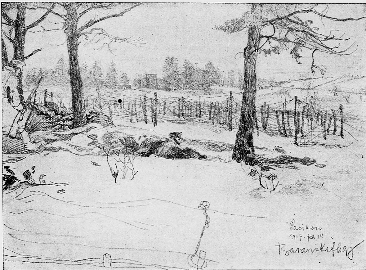
V prvej zákope na ruskom fronte.

Macedonský front. Pozdĺž celého frontu slabá delostrelecká činnosť. Od Čerňy na východ odrazili sme nepriateľské výskumné oddelenie. Pri dol. toku Strumy,