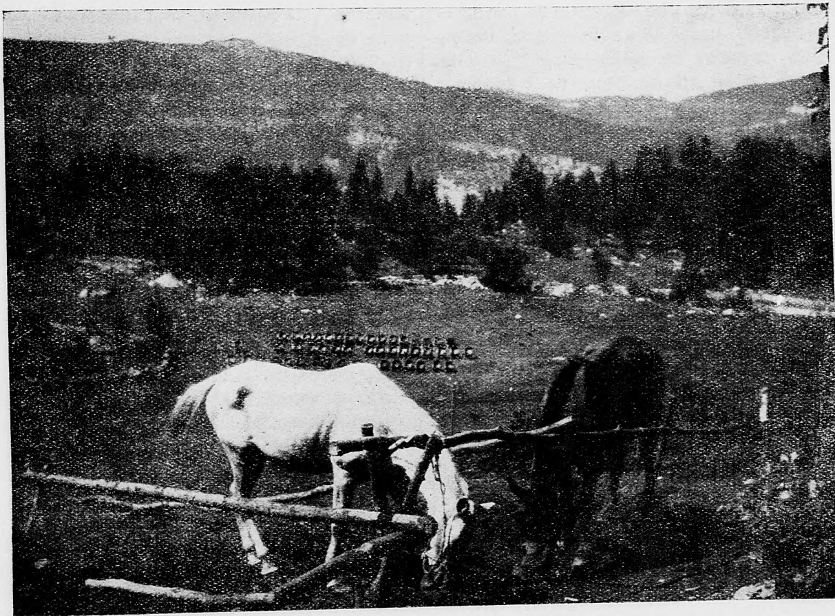
Trén za frontom v Karpátoch.

Aj v Rusku, v Kijeve utvorili tam žijúci Česi takzvanú «Českú družinu», ktorá bojovala proti monarchii