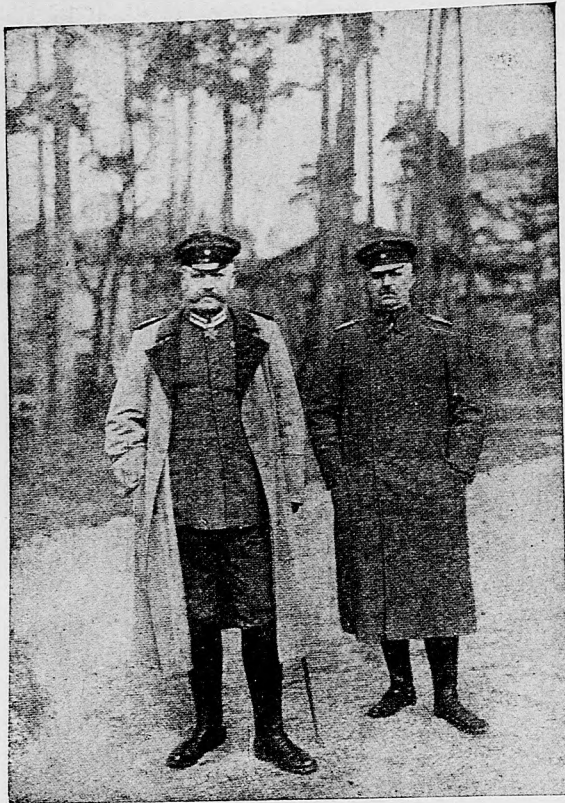
Hindenburg a Ludendorff na západnom fronte.

vané francúzske útoky proti Morriselu a Moreuilu. Na oboch brehoch Avre husté útočivé valy marne útočily cez horu Senecat a na oboch stranách hradskej Ailly—