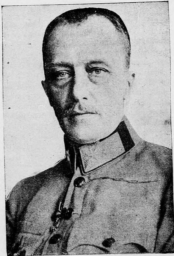
Gróf Ottokár Czernin, bývalý zahraničný minister.

Prenasledovanie židov v Galícii. Dľa zpráv lebergských novín v Galícii sú veľmi časté prenasledovania židov. Na železničných vlakoch cestujúci židia častejšie sú najväčším nebezpečenstvom vystavení a bývajú od cestovateľov krvavo zbití. V meste Stryj vy-