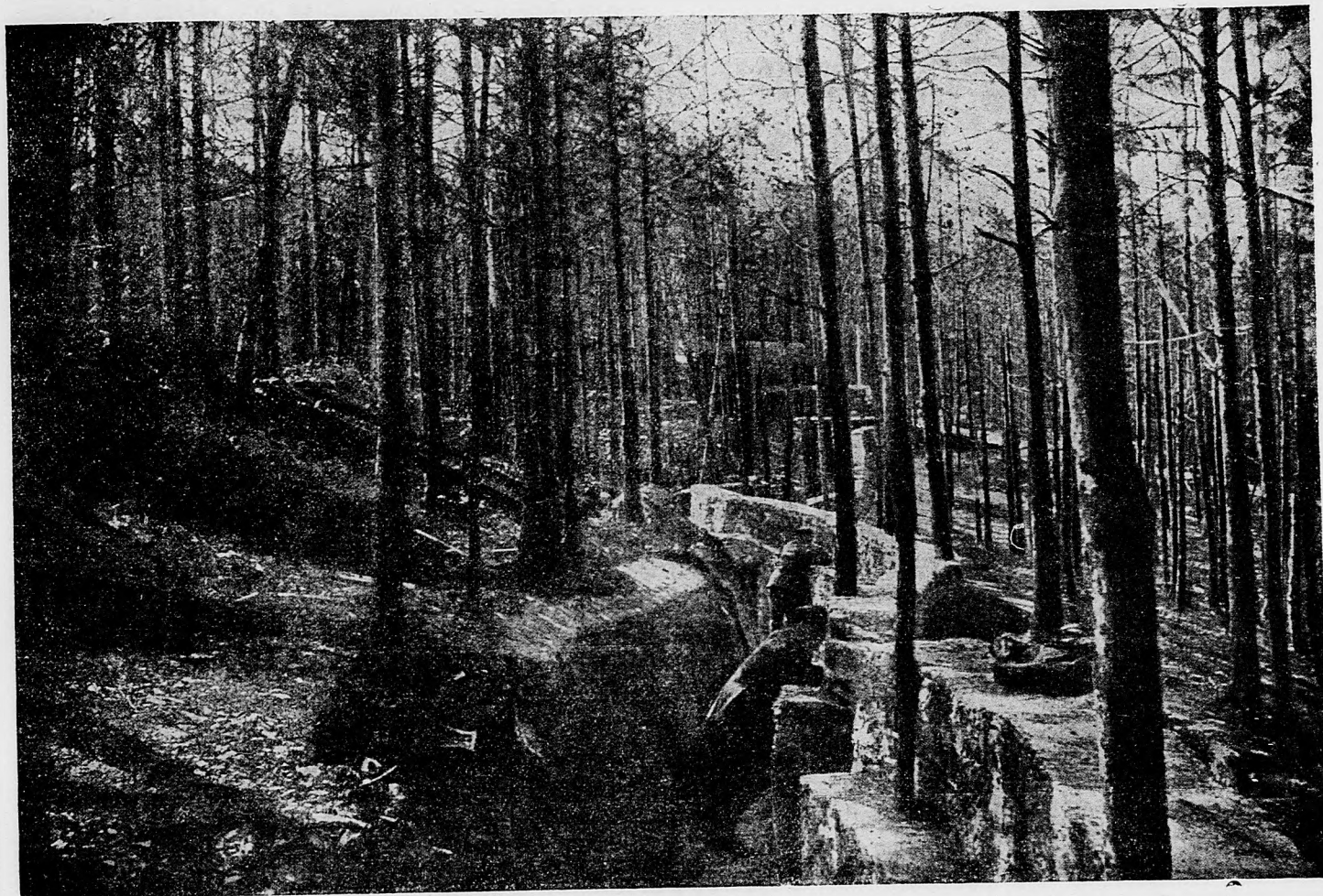
Talianske strelné zákopy.