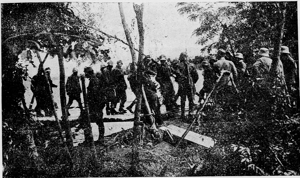
Prevážanie talianskych zajatcov cez Piavu.

— Zaneste chýr do našej vlasti o veľkolepých výkonoch našich čiat a odkážte domov, že my dôverujeme v zdar. V piatom roku veľkého zápasu vojna není maličkosťou ani na bojišti, ani doma. Toto vieme všetci a všetci túžime po pokoji, ale kým ho vydobijeme, zatiaľ tak neohrozene budeme stáť na svojom mieste, ako v prvých štyroch rokoch vojny. Ak takto bude, a tak bude, vtedy dosiahneme cieľa.