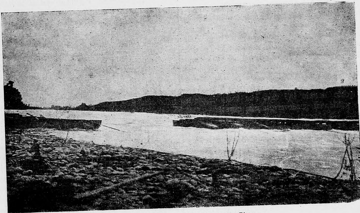
Povodňou pretrhnutý válečný most na Piave.

Vláda nech nariadi popísať koľko sudov potrebujú majitelia viníc a — ako to žiada stoličný výbor sabolč-