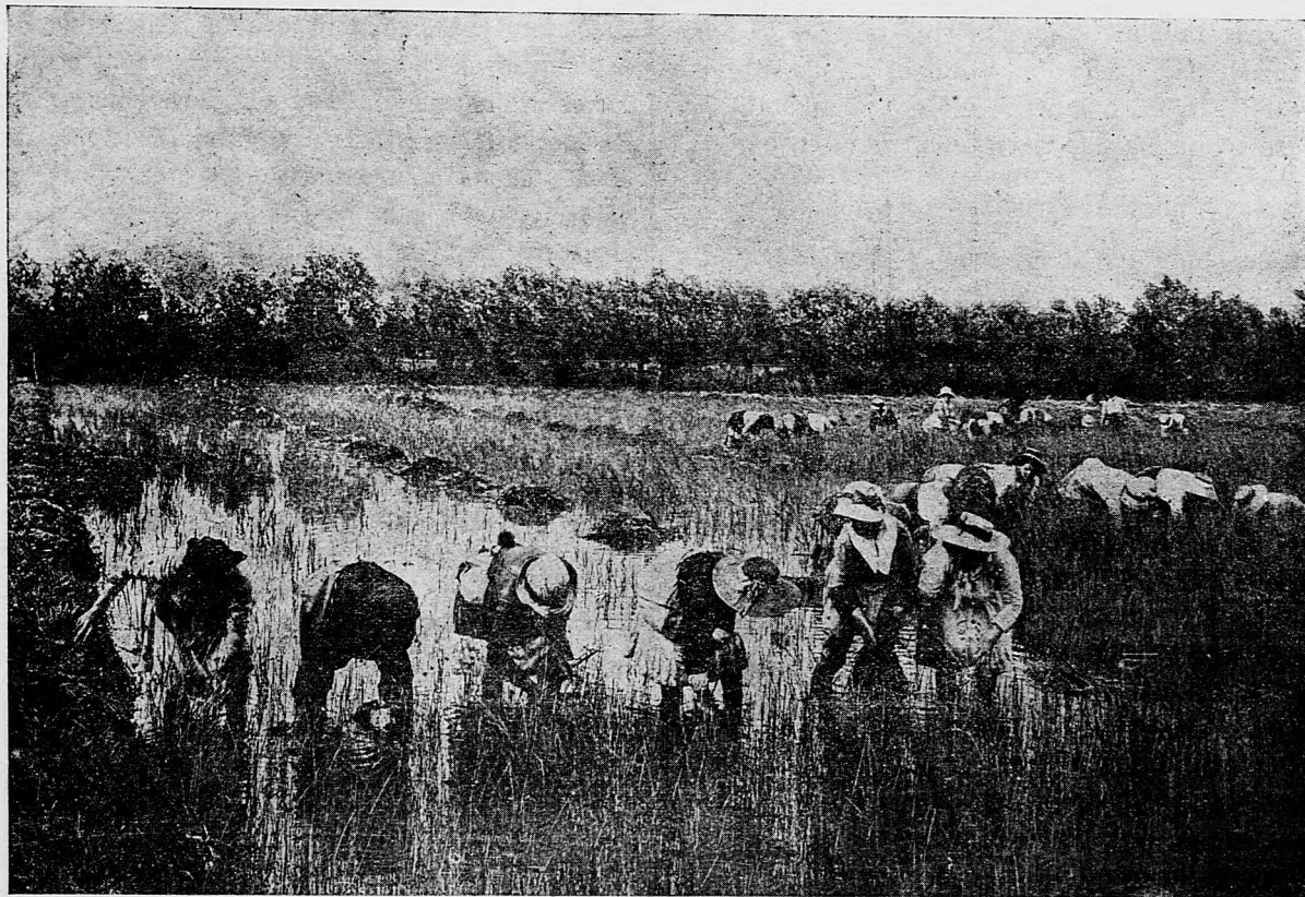
Žatva ryže na zaujatom talianskom území.

Kresťania katolíci, kupujte len u kresťanov!