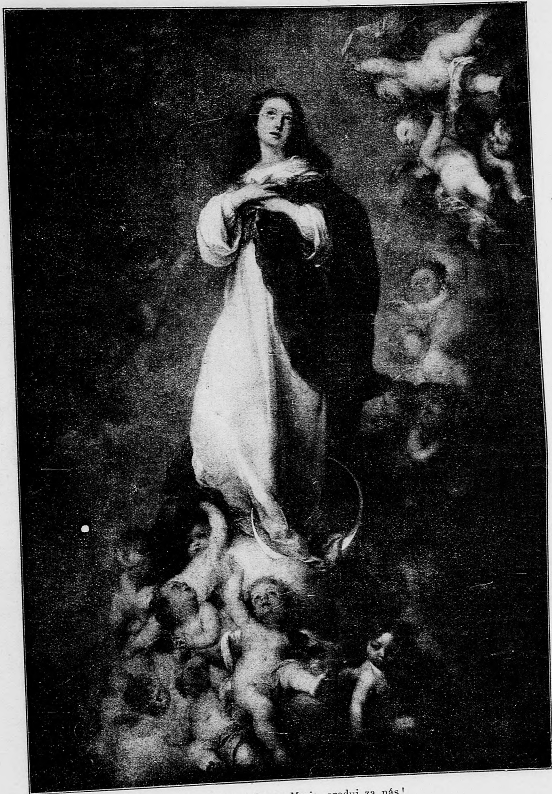
Blahoslavená Panno Maria, oroduj za nás!

lenými víťazstvami, ktoré, žiaľ Bohu, všetky boli na darmo. O všelijakých huncútstvach tejto smutnej doby nechcel som obširnejšie písať, ač práve sme z toho dost tu mali. Nitrianska stolica, neviem prečo, musí vždy na