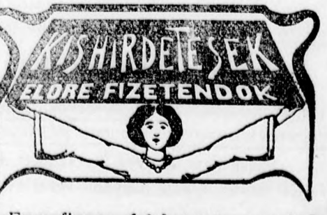
Egy finom fehérnemű varró nő lakik: Linczeg-u. 9. sz.