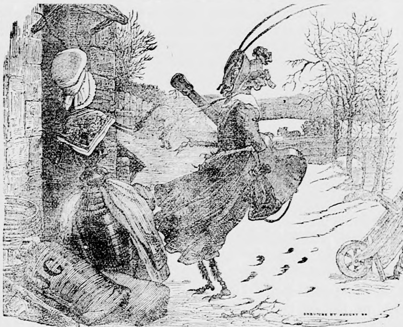
A hangya és a tüsök.