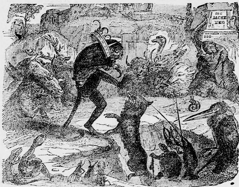
A majom mint király.

fején. — „Helyes, helyes! elfogadtatik!“ — kiáltott a róka, s utána az egész érdemes gyülekezet.