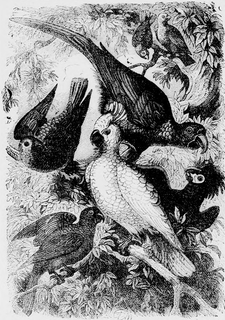
Papagályok. (Lásd szövegét a 333. lapon.)

színelőadásokat. A színhely kerek, vagy még inkább hosszúdad, — magas, erős falal körülvéve, melyen kívül a közönség ülőhelyei vannak. Ezen ülések és páholyok alatt vannak a bikák ólai, hol zárva tartják őket az „ünnepély“ (!) megnyitásaig. És ezen ólakban már előre dühbe hozzák a bikákat, dárdákkal szurkálják és mindenféle kép ingerlik.