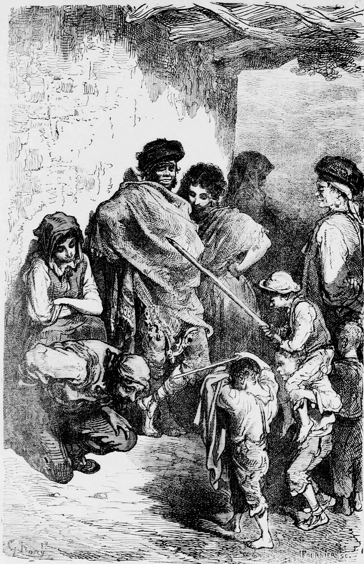
Bikaviador és családja. (Lásd szövegét a 331. lapon.)