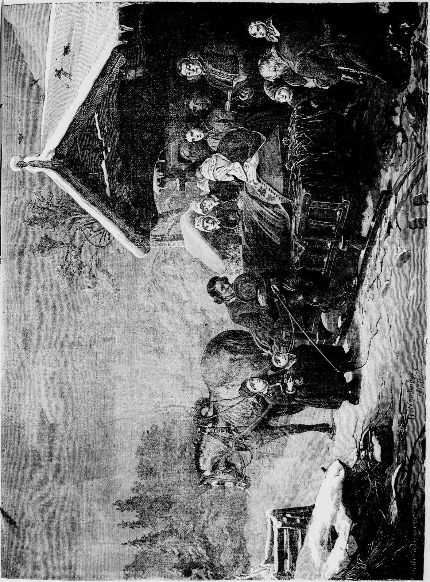
Az utolsó út. (Lásd szövegét az 603 lapon.)