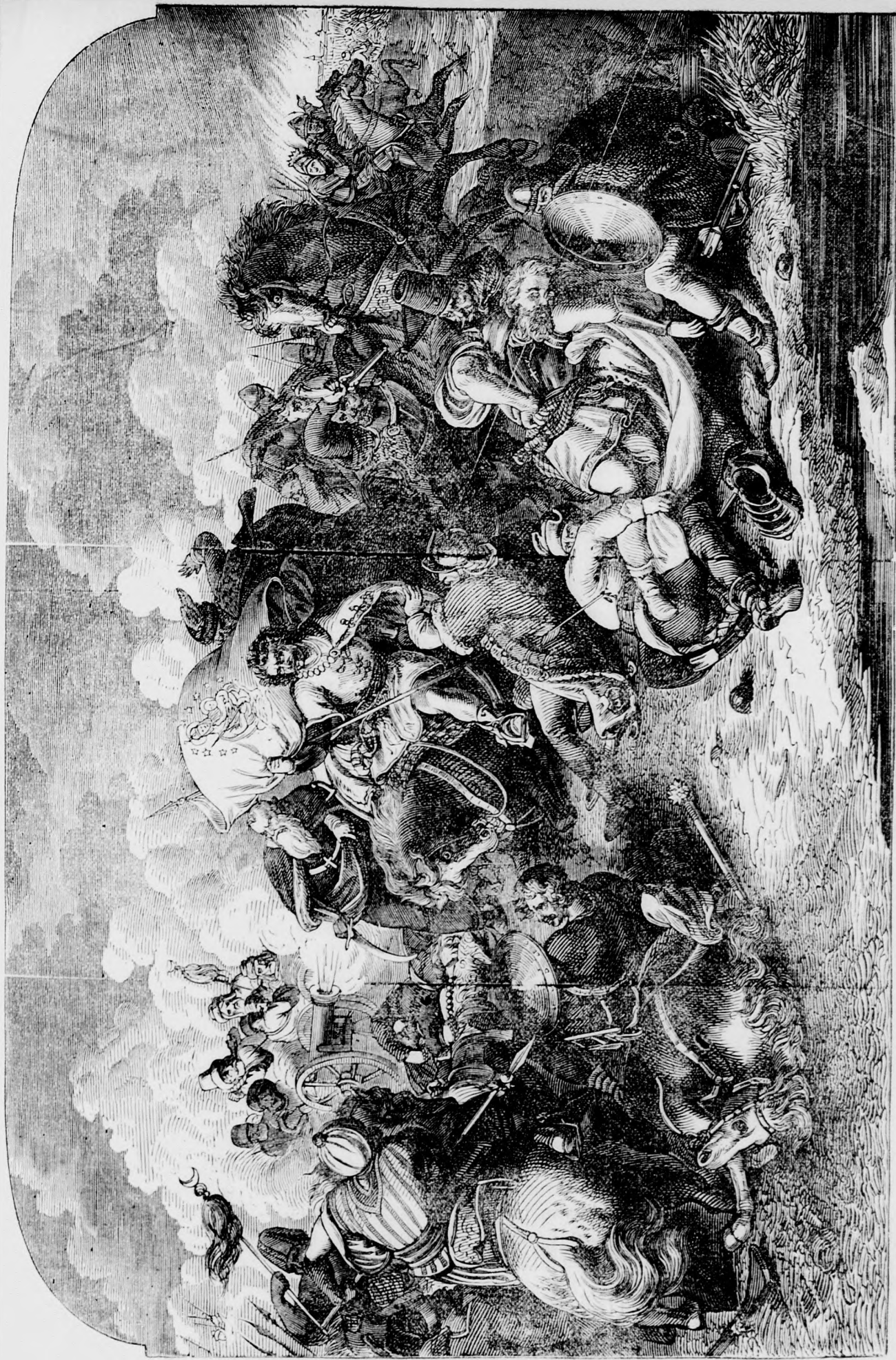
A mohácsi esztia. („A honszerelem vértanui” című vershez.)