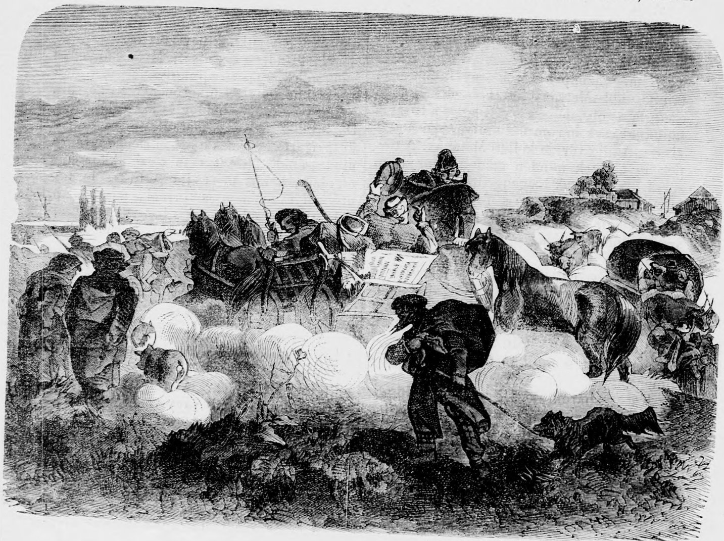
Hazatérés a vásárról.

Hanem szegénynek sok baja van mindennel. Védeni kell magát a dévaj fiatalságtól, mely hosszú szakállára élcel; védeni