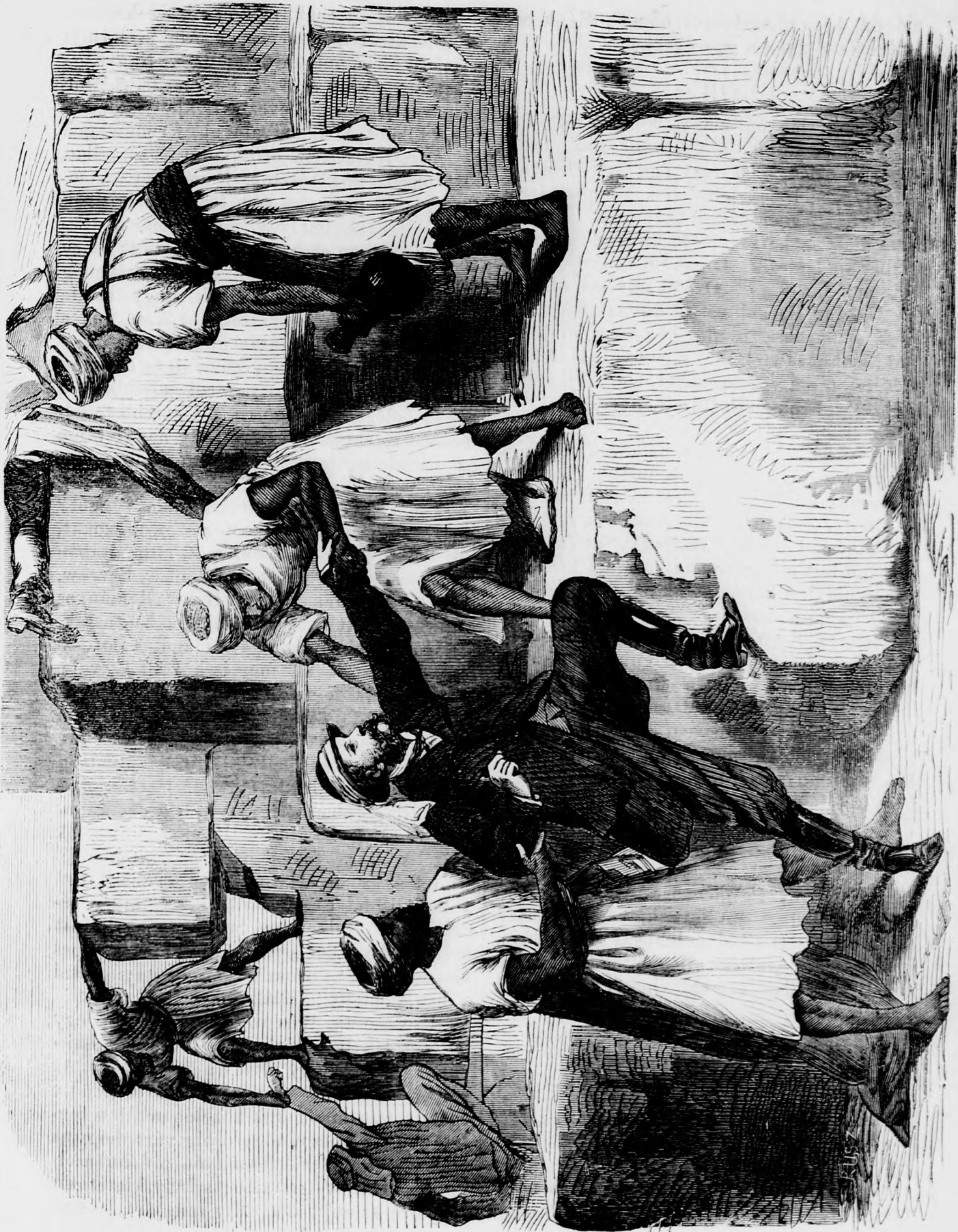
A király a Cheopsz-gulán. (Lásd szövegét a 667. lapon.)