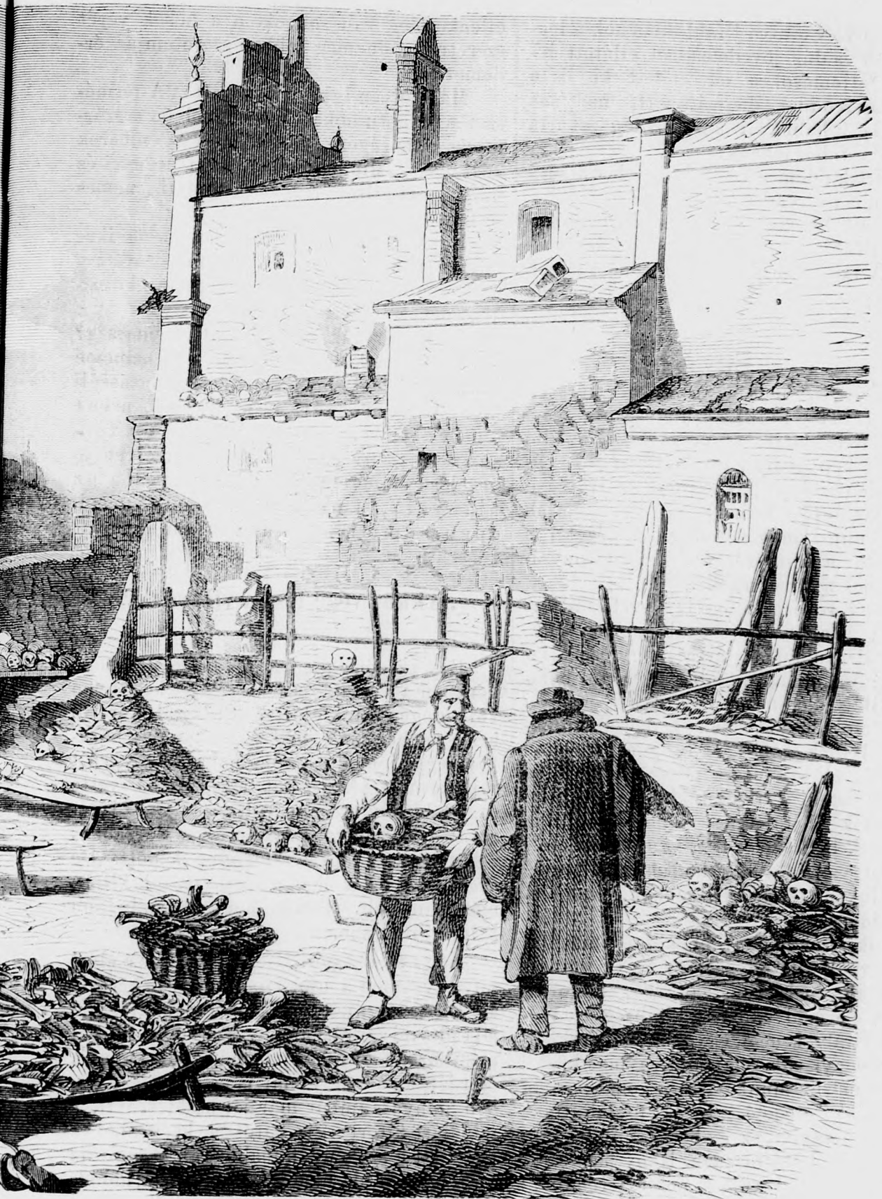
A szolferinói esonthalmok.