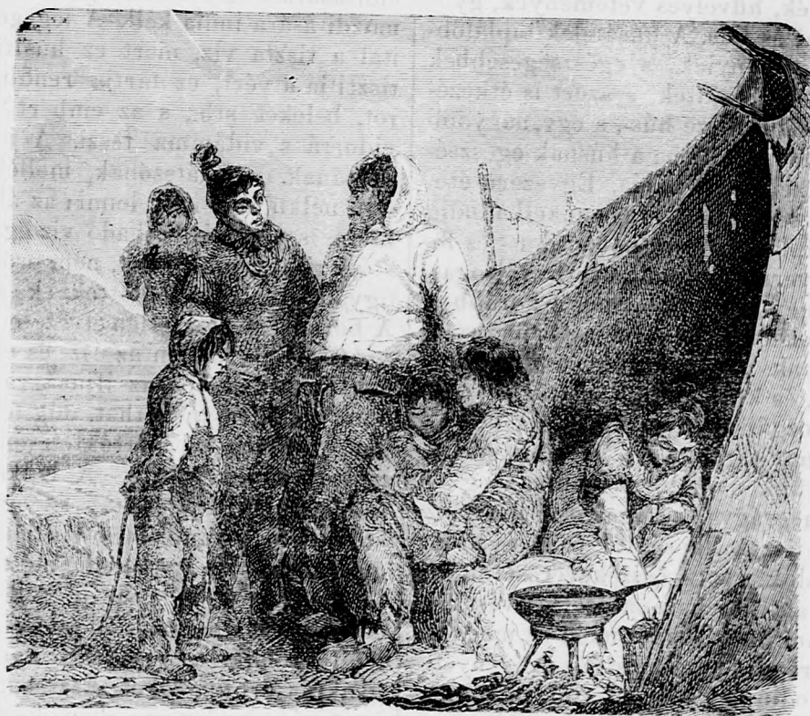
Grönlandi eszkimók nyári tanyájokon.

Tavaszkor születik, meghal a rózsákkal, Szellő szárnyán uszik szeplőtelen légben;