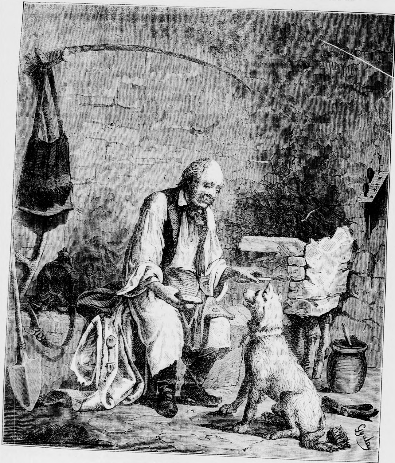
Az öreg csász ebédje.