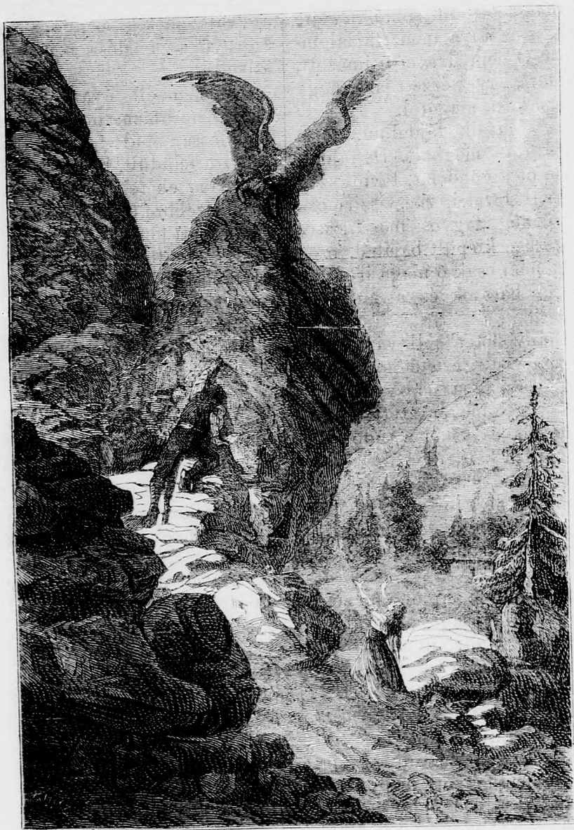
A gyermekrabló sas.

mint egy türelmes anya kedvence beteg-ágyánál. Minden ember ismerte a gyászos alakot, s nem egy szem nézett rá szánalommal, midőn oly csendesen ült ott s a sirra és a fűzfára nézett, vagy gyöngéd