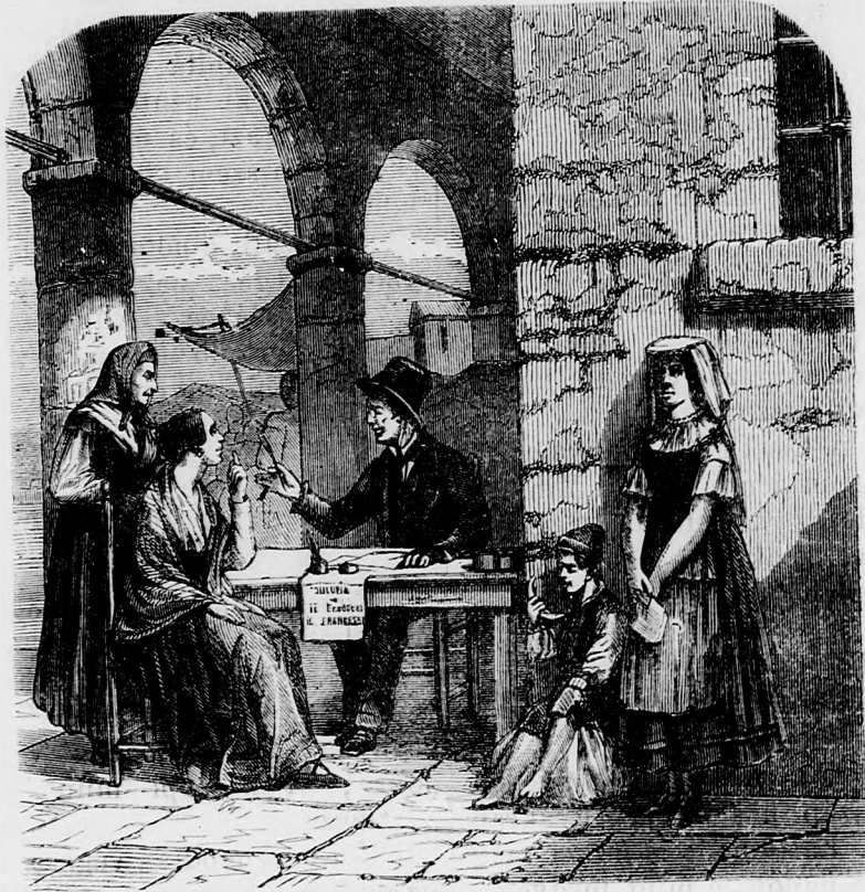
Nyilvános irnok Nápolyban.

— Ezek az öreg koldusok okos emberek ám!