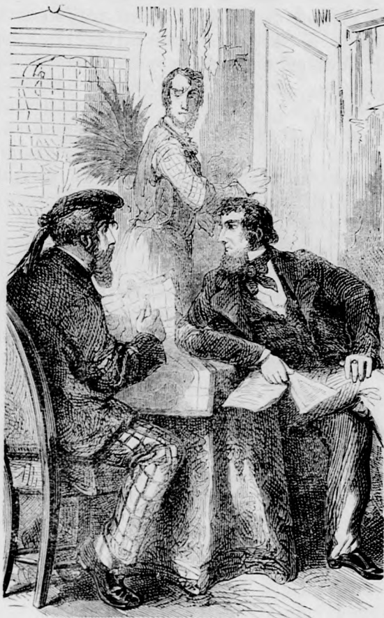
A három utitárs.