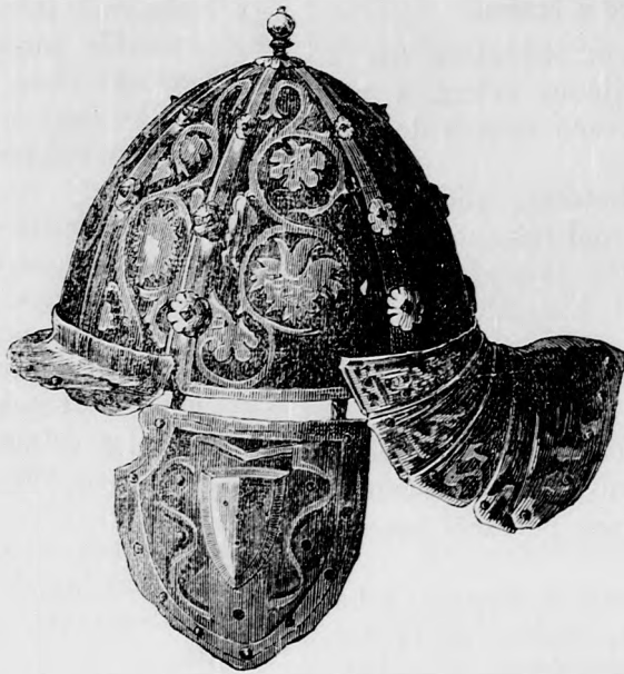
Mátyás király sisakja.

A basa ezután hátranyujtotta zsiros kezét a mögötte álló inasnak (a többi szintén úgy cselekedett), ki a kezénél levő nedves szivacsosallal megtörülte azt, mely műtétel után ismét valamennyi belemarkolt a tálba. Szörnyen csodálkoztam ezen divat fölött, de annyira még sem, hogy ne követtem volna példájukat, elgondolva, hogy: „ha Rómában vagy, római szokás szerint élj,“ a mi más-kép annyit tesz, hogy: nem jó törökkel egy tálból enni.