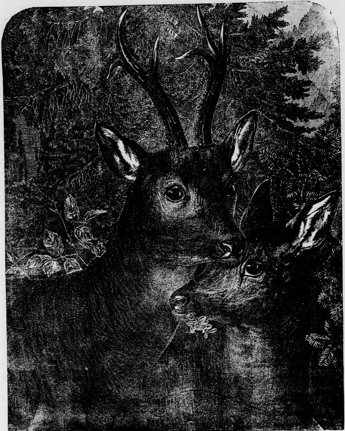
Őzek az erdőben.

— meddig kell még veled vesződnöm? Nem szégyenled magadat, hogy olyan lusta vagy e fűre paripák között? Hollá! No hát