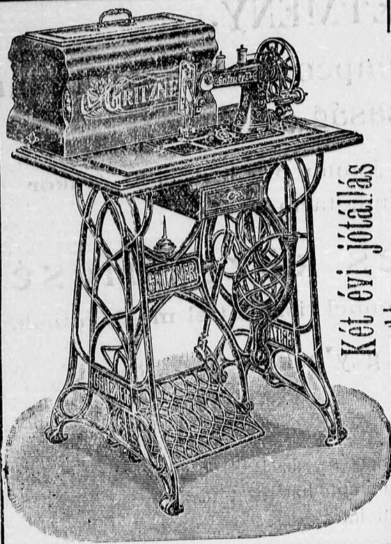
Két évi jótállás