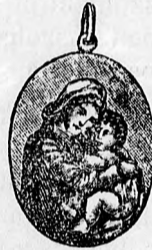
BÉRMA AJÁN- DÉKOK

Legnagyobb választékban ajánlják arany- és ezüstóráikat, valamint ÉKSZEREIKET ez alkalomra mélyen leszállított árakon. Képes ÁRJEGYZÉK bérmentve.