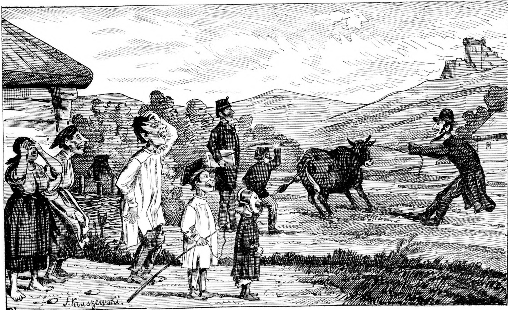
Iczig pályája. II. Folytatás árverésen. (Folyt. következik.)

— Az egyetem jubileuma. Budapest főtanodája, a tudományos egyetem fényes ünnepélyt ült meg alapításának 250 és ujjaalakításának 105 évfordulóját. Az épületen kitűzött zászlók hirdették a járókelőknek, az ünnepet. Az ünnepélyt megelőzte az egyetemi tem-