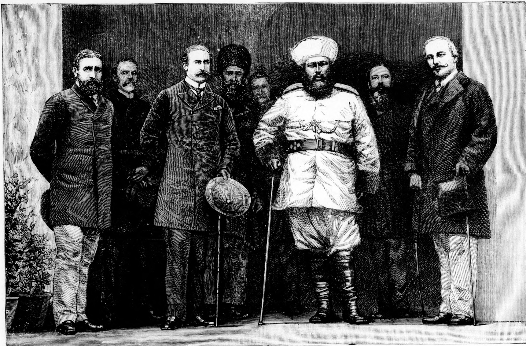
Lord Dufferin es az Emir tábornoka.

Kivéve a szándékos gyújtás ritkábban előforduló eseteit, a legtöbb tüzeset oka a gondatlanság; erre mutat az a körülmény, hogy a tűz-