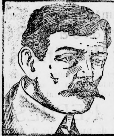
Înainte de întrebuițare.