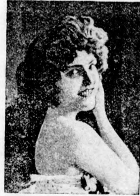
Csak olyan készítményt fogadjunk el, amelynek csomagolásán a kép látható.

Minden nő, aki csak némileg ad arca üdéségére, nem mulaszthatja el még a tavasz beállta előtt a