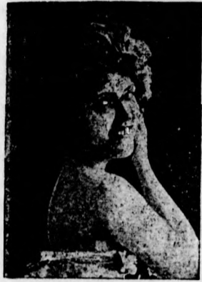
Csak olyan készítményt fogadjunk el, amelyek csomagolásán a kép látható.

Hanyagosság szülte ok a hajhullás , fejkorpásodás és egyéb fejbőr- és hajbetegség; mivel megszűnik mindez, ha a „Garay“-drogeria által előállított hajszeszt használjuk. Ára: 2 korona .