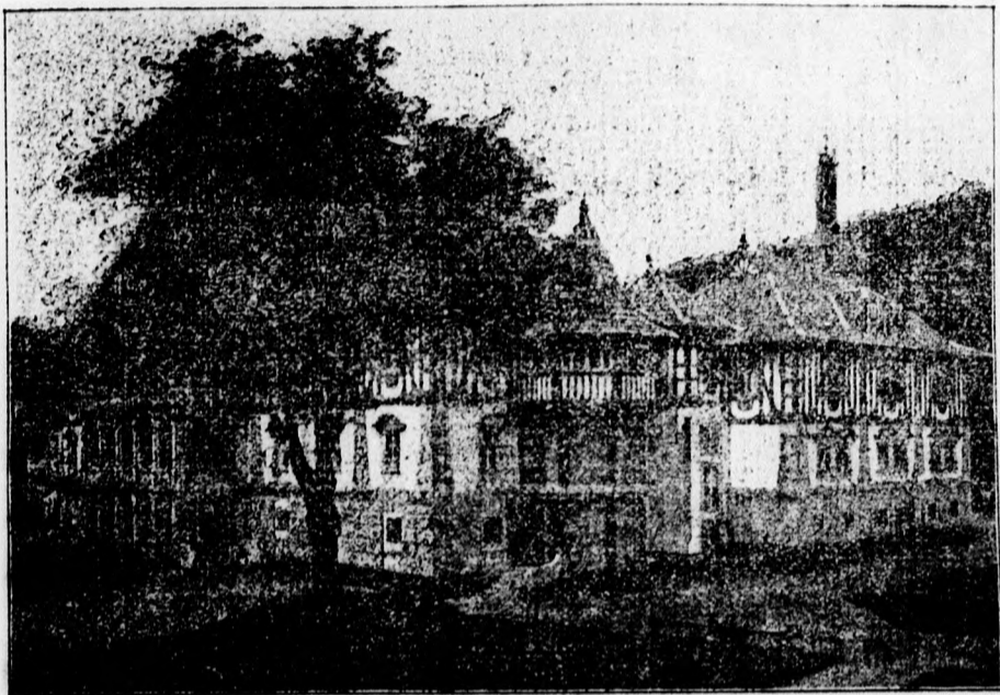
Jánov Dom. Prestavený dľa arch. Jurkoviča.