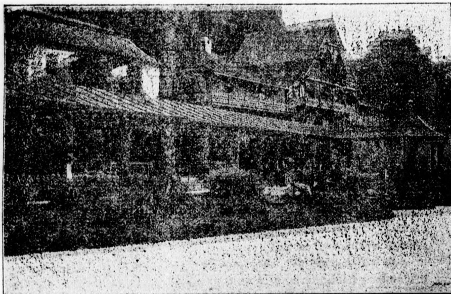
Stará kolonáda a námestie.

Po celom svete roztrúsené sú veľké dary Božej prírody, ktoré slúžia k občeršteniu ľudstva a k liečeniu chorých. Na úpatí veľkých hor, uprostred lesov nalezáme liečivé pramene a užitočné vody, ktoré menujeme dľa toho čo je podstatnou čiastkou ich zvláštnej sily a liečivosti.