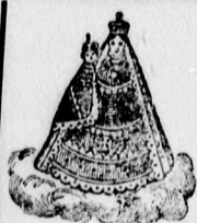
Ochřanná známka Založeno r. 1718.