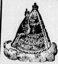
Ochranná známka Založeno r. 1718.