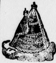
Ochranná známka Založeno r. 1718.