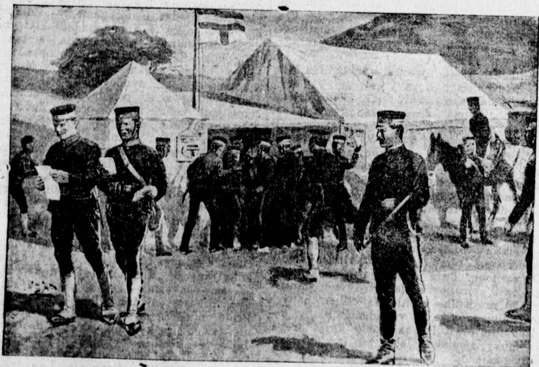
Tu zase vidíme ako sa v polnom ležení rozdeľujú vojakom príslé listy z domova, a vidíme ako každý s dychtivosťou a s vyjasnenou tvárou hltá obsah listu, tak že zapomína na všetky útrapy vojny.