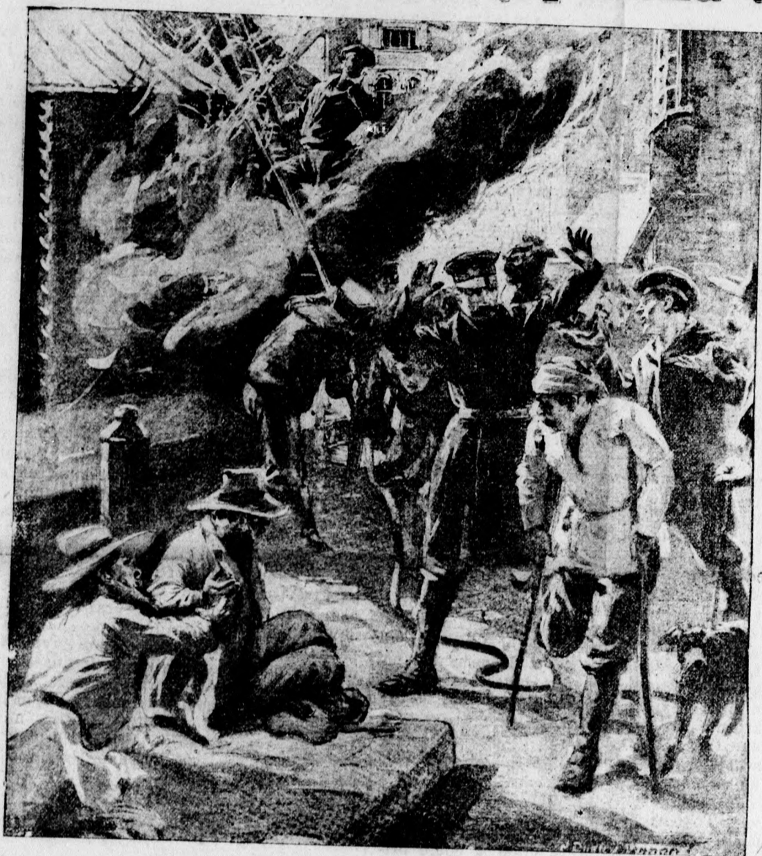
Dnes prinášame et. čitateľom vyobrazenie strašlivých scén pri bombardovaní Port-Arthuru, ktoré sme už v minulých správach, o vojne, opisali.