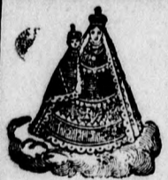
Ochfanná známka Založeno r. 1718.