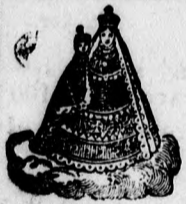
Ochfanná známka Založeno r. 1718.

J. Pilnáček, Hradec Králové, Kráľ. České. Založeno roku 1816.