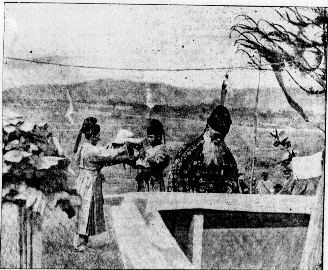
Budhistický kňaz a jeho pomočníci vykonávajú svoje modlitby.