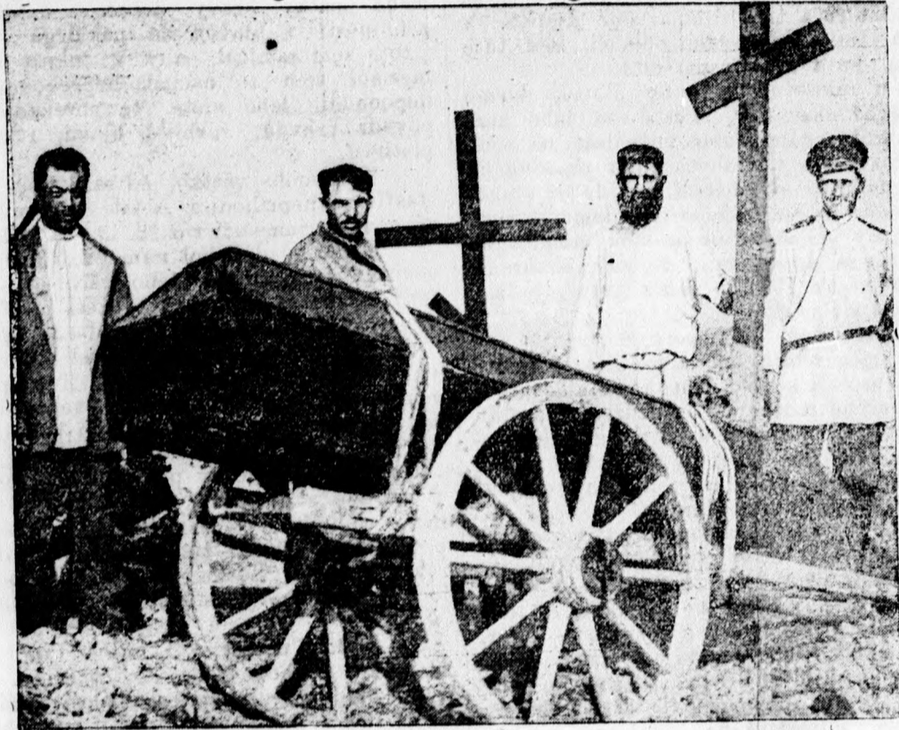
Pohreb ruského vojaka v Mandžurii.

Týždenník venovaný ku poučeniu a vzdelaniu slovenského ľudu.