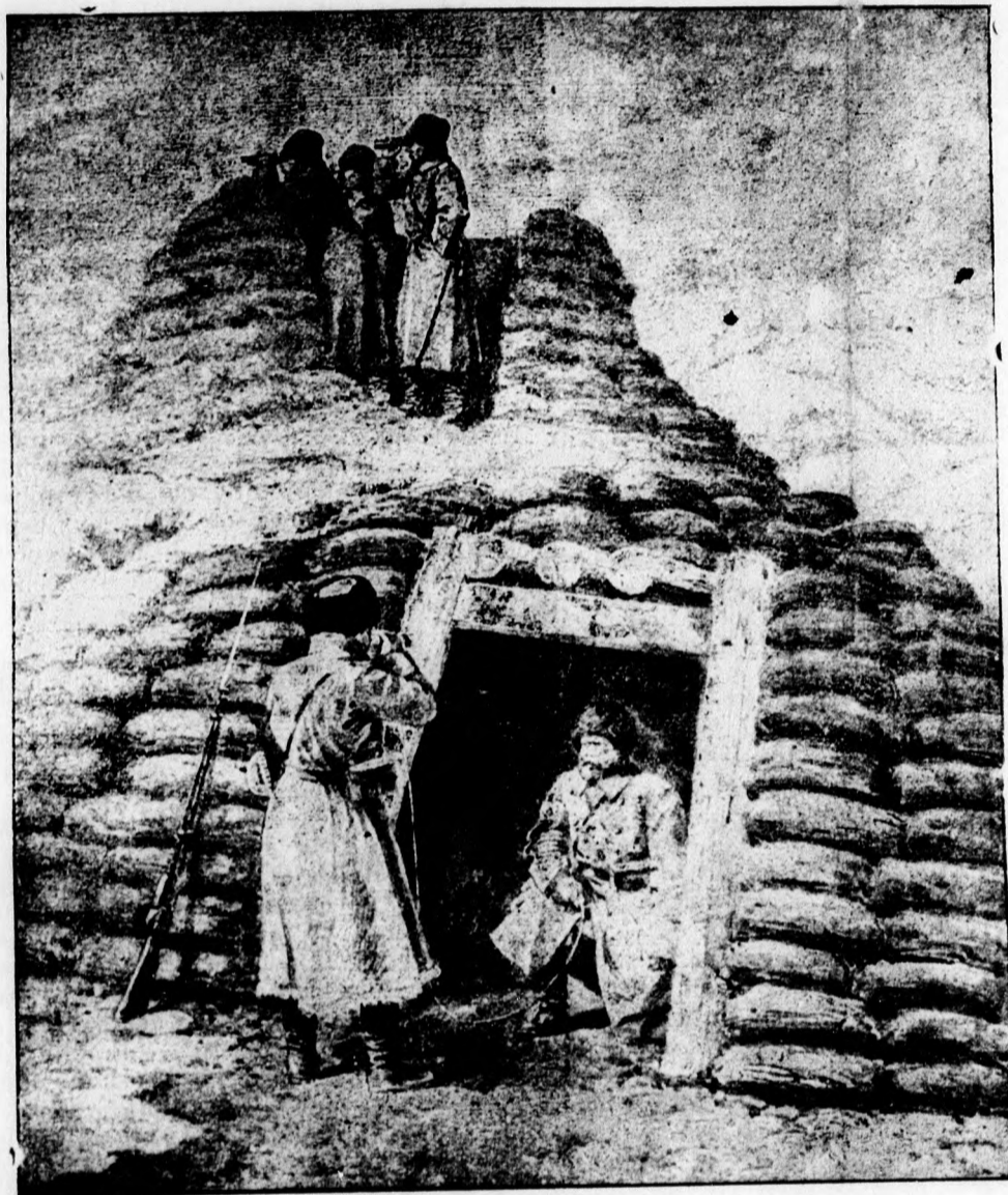
Telefonické rozkazy v ruskom tábore na bojišti v Asii.

Prítomný obrázok predstavuje nám ako ruský dôstojníci s návršia pozorujú polohu armády na bojišti a rozosielať telegrafické rozkazy.