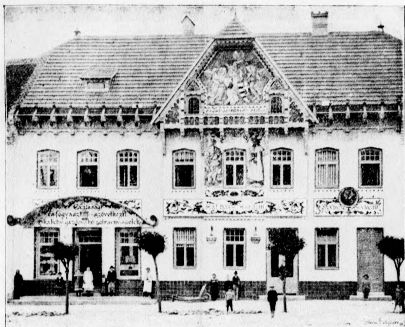
Katolícky spolkový dom v Uh. Skalici.

Týždenník venovaný ku poučeniu a vzdelaniu slovenského ľudu.