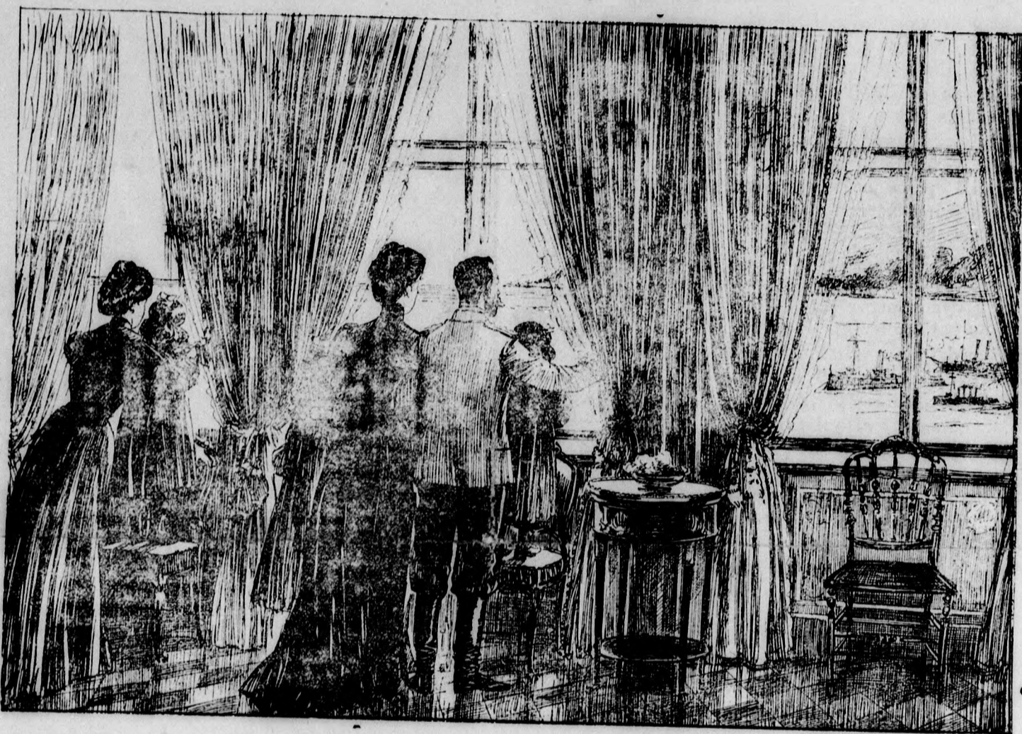
Cár Mikuláš II so svojou rodinou pozerá z obloka zimného paláca na demonstrácie ľudu v uliciach petrohradských.