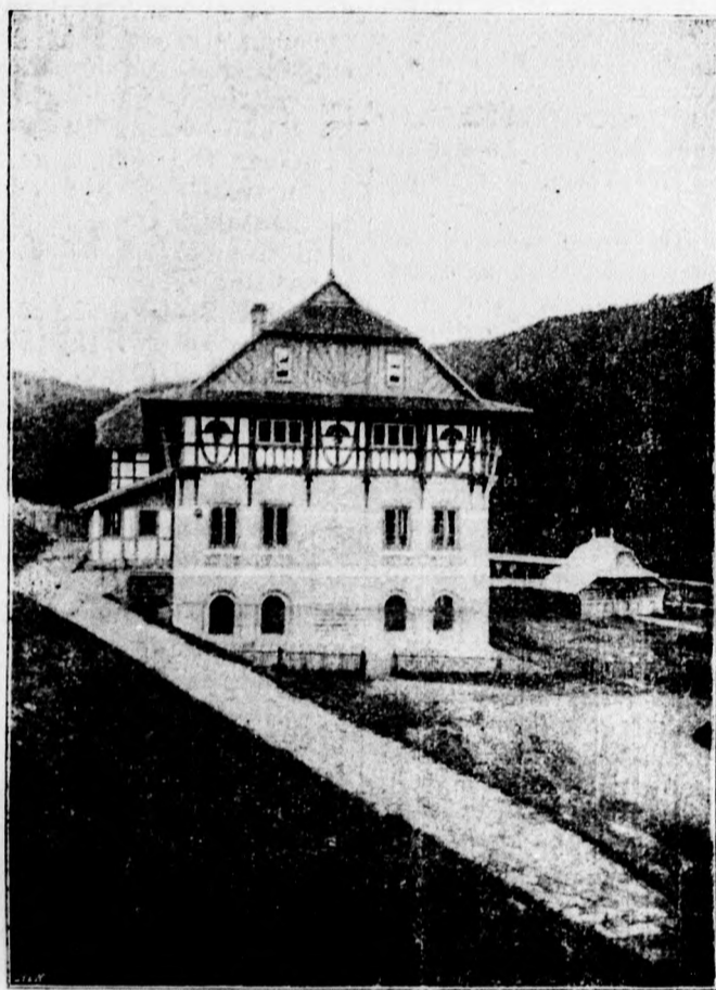
Vodoliečebný ústav v Luhačovicach.