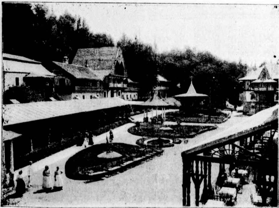
Námestie a kolonáda v Luhačovicach.