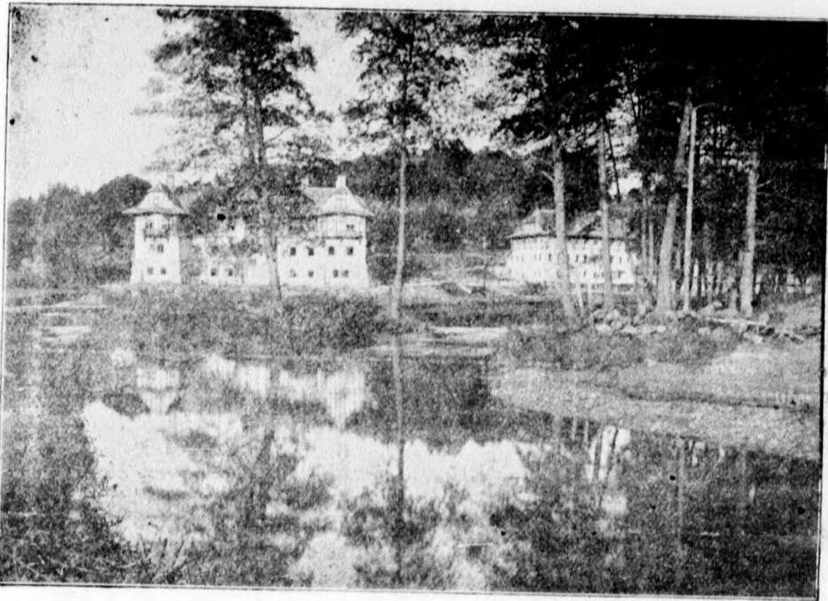
Pohľad na vilu „Jastrabi“ a „Vodoliečebný ústav“.