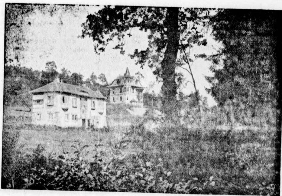
Villy „Vi stimila“ a „Praha“.