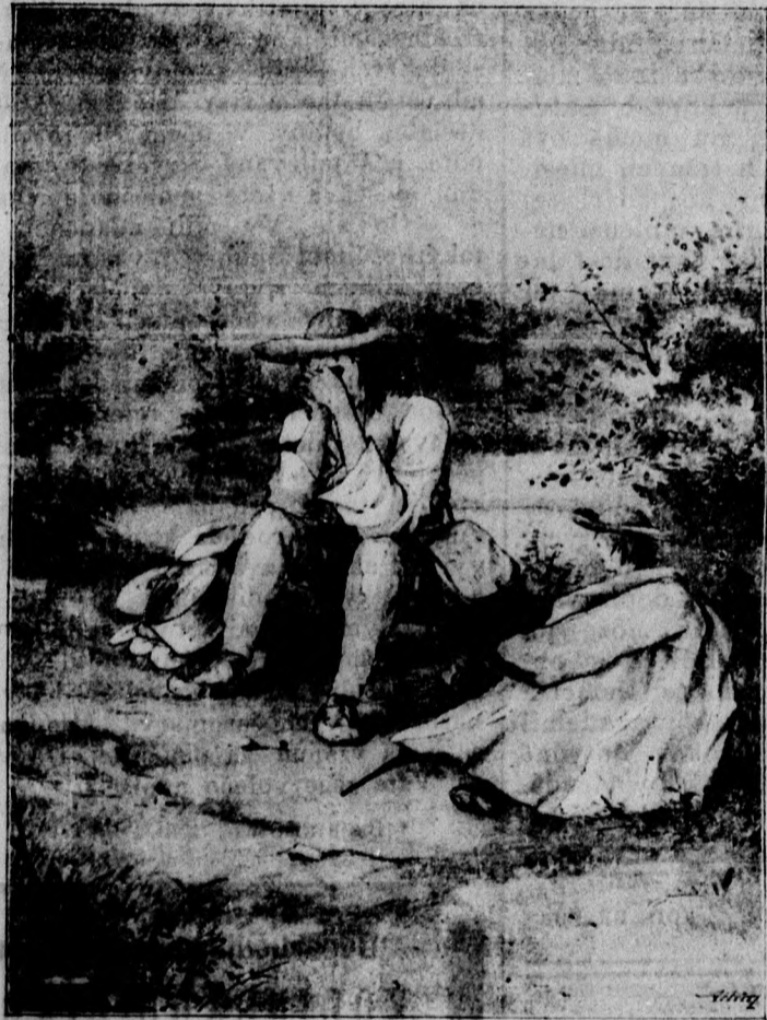
„Drotári, drotári, jako divé husy po ďalekých krajných potlkat sa musí.“ Trenčianska.

Tak sa časy menia! Pred rokami — nie je dávno tomu — stá a stá drotárov ubieralo sa do sveta na „drótočku“. Zašli slovenskí drotári do Nemecka, do Ruska, v Paríži videl ich človek na boulevardoch, na Sibíre, v Mandžurii, všade známy bol náš drotár jako striezlivý, sporivý, pootivý človek. Čo nedoprialy trenčianske hory, lasy, to nahradil drotár grošom zo sveta. Boly vtedy lepšie časy! Ale i drótovanie zmenilo sa s behom času blachové nádoby, železné hrnce, zničily drotársky priemysel a náš chudobný Trenčan vyhladáva Ame- riku viac, nežli pohostinné zeme, jako Čechy, Rusko, Nemecko, Fran- ciu, Moravu. Tisíce trenčanov je v Amerike a státisíce posielajú domov. Takí sú vlastenci! Tak milujú vlasť! Lož je tvrdiť, žt Slováč nemí- luje svoju vlasť!