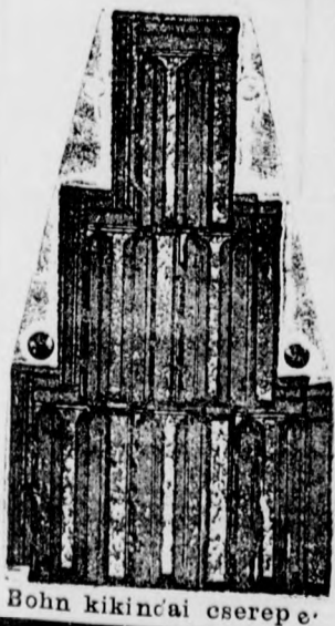
Bohn kikindai cserepe.