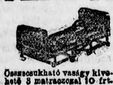
Osztoskapható vasgy kivehető 3 matracosnál 10 ft.