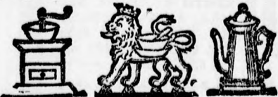
Védjegy. Védjegy. Védjegy.

féle gyártmányt kérni, oly végből, hogy a mindenkor egyenlő és legjobb minőség iránt meg legyen a kellő biztosítéka. — Ügyeljen emellett a védjegyekre és aláírásra, mert csomagolásunkat azonos színekben és papírban, valamint hasonló nyomtatással utánozzák.