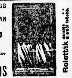
Roletták a legjobb feljebb.

Árjegyzéket bárkinek ingyen és bérmentve küldök.