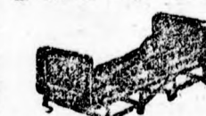
Összevasható vasgy kivehető 3 matracossal 10 ftt.