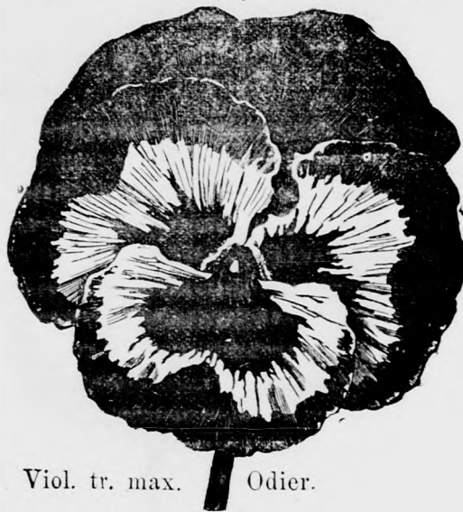
Viola tr. max. Odier.