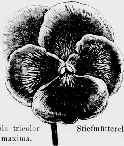
Viola tricolor maxima.

Врло лепо рано цвеће. Многи га негују са свог лепог разбојног великог и раног цвета. Сеје се поглавито ради шарања цветних леја. Размножава се семеном а по том и цепањем корена. Ово се последње чини тада када смо ради да нам појешине леје једном врстом дана и ноћи буду опасане или баш испуње.