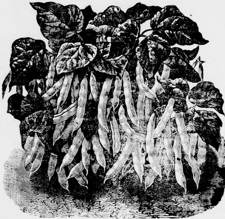
Воштаник кућерац. (Cylinder-Wachs Buschbohne.)

Пасуљ не воли јако нагнојену земљу, но мршавију, али да је што више сунцу изложена. Посејемо ли пасуљ у скоро нагнојеној земљи, сву своју снагу душта у лозу и лишће, а врло слабо на плод. Пасуљ се несме сејати пре свршетка месеца априла, јер како изникне, врло је нежан, а особито осетан на мразу. Довољно је да падне само мали мраз, па да га одма